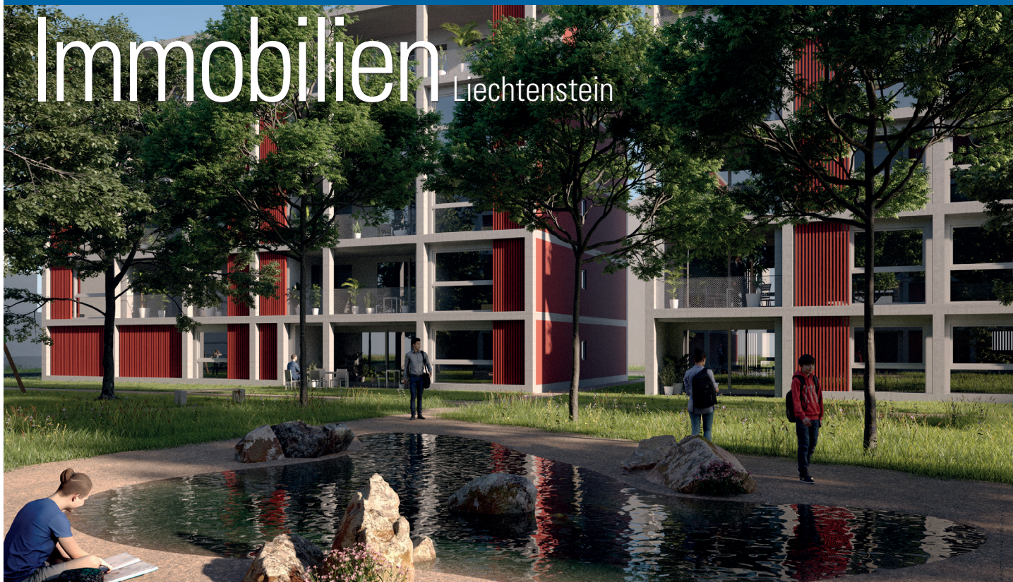
Kaufangebot: Eigentumswohnungen Wohnsiedlung Oberfeld Süd Triesen