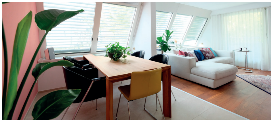
Ess- und Wohnbereich

Acht Wohnungen mit Grössen von 43 bis 156 m 2 verteilt im Erd- bis Attikageschoss warten auf Sie. Alle Wohnungen sind individuell, verfügen über einen Balkon und versprechen einen spannenden Grundriss. Die Liegenschaft verfügt über einen Aufzug und eine Tiefgarage. Im Aussenbereich sind Aussenparkplätze sowie die gedeckten Parkplätze angeordnet. Interessiert?