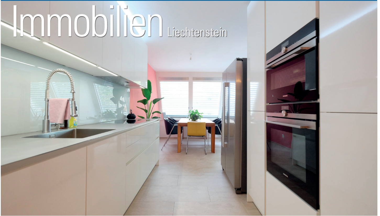
Eigentumswohnungen im Birkenweg 6, Vaduz

› Kaufobjekt: Wohnen im Herzen von Vaduz