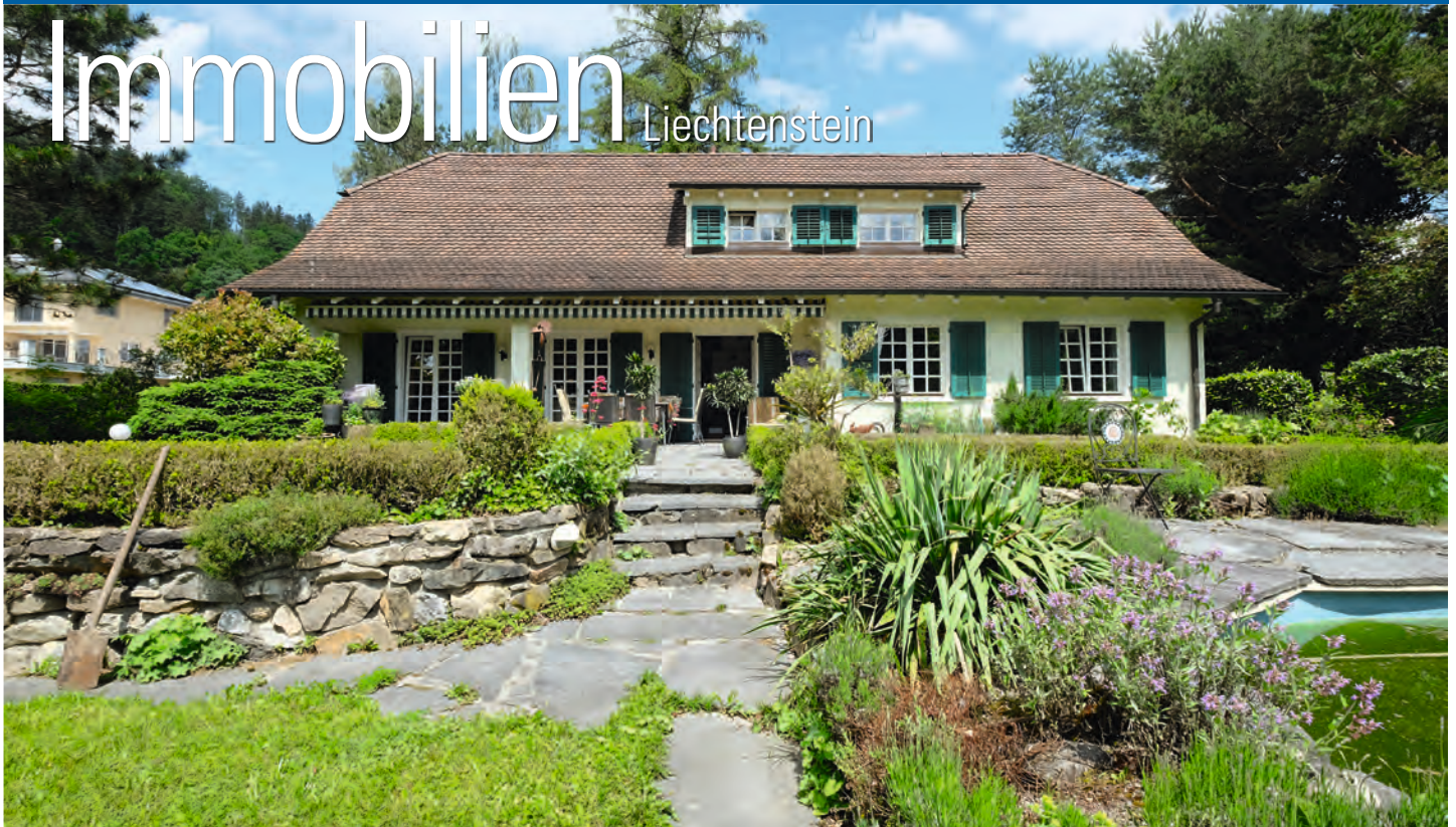
Kaufangebot: 6.5-Zimmer Wohnhaus im Aspergut 2, Eschen