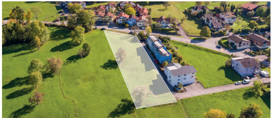
Traumhafte, leicht erhöhte Wohnlage in Schaan