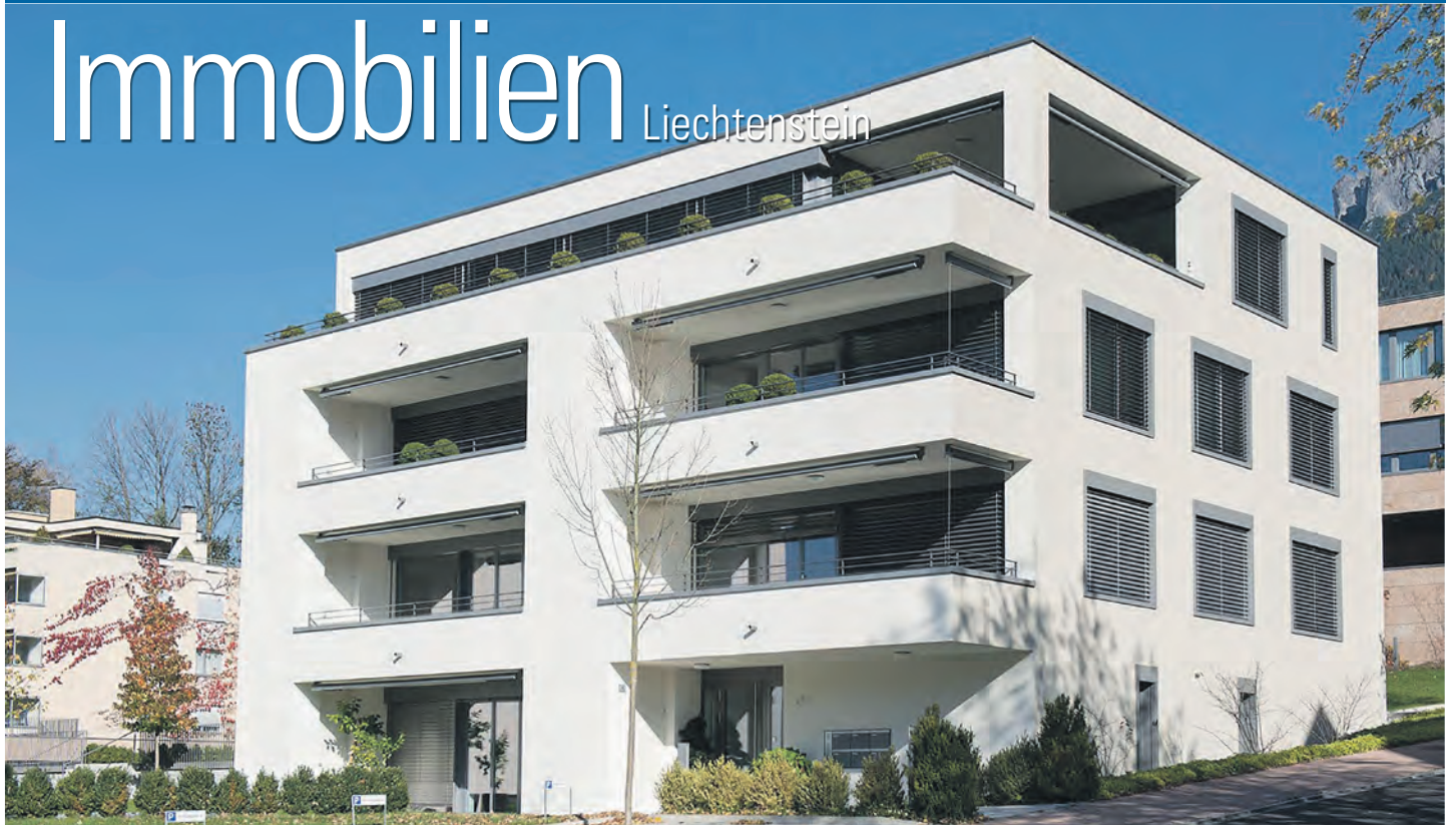
Mietangebot: Immagass 4 in Vaduz

› Mieten: Attraktive und moderne Wohnung in Vaduz