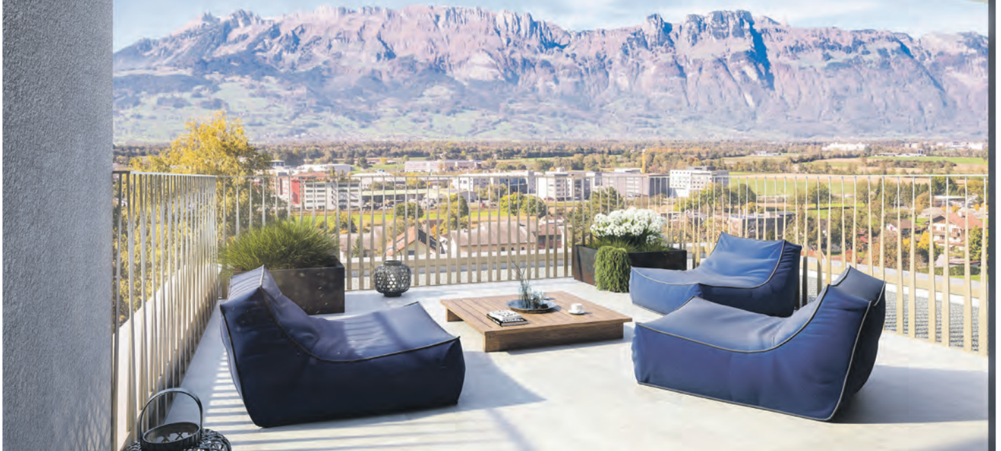
Kaufangebot: Attikawohnungen «Im obera Gamander» in Schaan

› Kaufobjekt: 3.5 bis 5.5 Zimmer-Eigentumswohnungen in Schaan