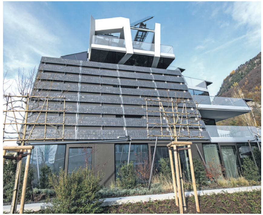
Auch die Fassade des Marxer Active Energy Buildings wird für die Energiegewinnung genutzt.