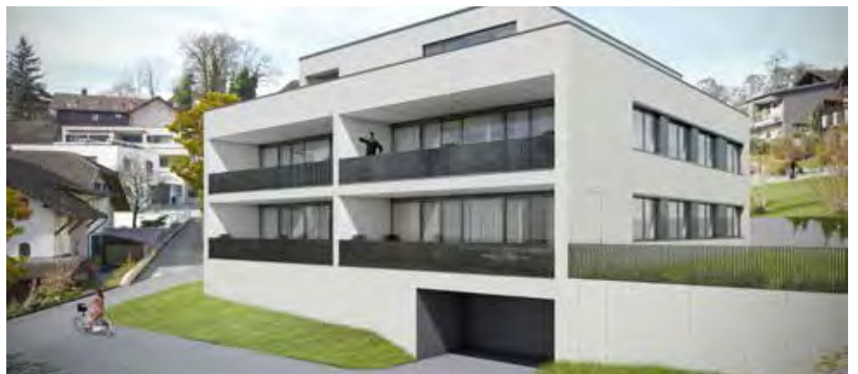
Eigentumswohnung mit Blick auf Eschen