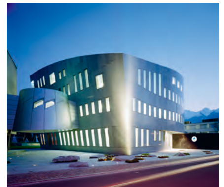
Neues Zuhause: Kirchstrasse 3, Vaduz

Gerne beraten wir Sie bei allen Fragen rund um Ihre Immobilien, Immobilienwerte oder Immobilienträume.