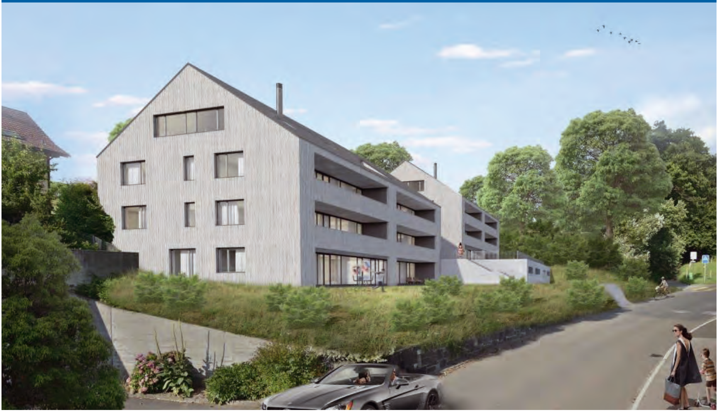
Kaufangebot: Neubau Eigentumswohnungen an der Widagass in Gamprin-Bendern (Neubau 2016)

› Eigenheimträume? Garten-, Geschoss- und Dachwohnungen zu kaufen